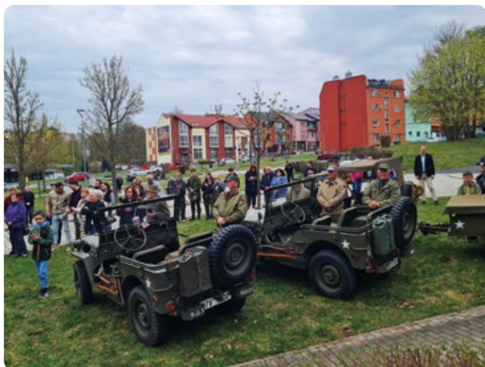
Historické vozy budily zájem návštěvníků