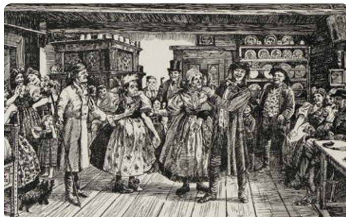
K svatebním tradicím patřila i scénka s falešnou nevěstou