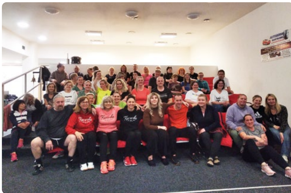
Týmy pedagogů ze všech škol pohromadě

Jednalo se už o druhý ročník pod křídly Zdravého festivalu, letos se organizace ujala základní škola v Kamenné ulici. Hrál se na dvě kola, bylo připraveno pohoštění a po celou dobu vládla báječná atmosféra. ZŠ Kamenná tímto děkuje za poskytnutí kuželny spolku Kuželky Aš.