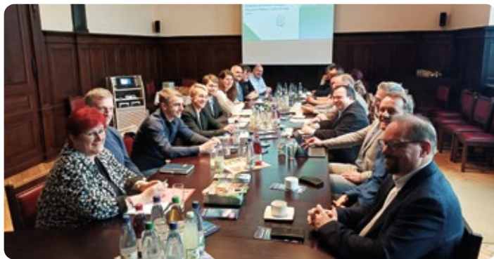
Pracovní jednání volného svazku obcí Přátelé v srdci Evropy proběhlo na radnici města Adorfu

Ve středu 15. 4. 2026 proběhlo pracovní setkání představitelů dobrovolného svazku obcí z česko-německého příhraničí.