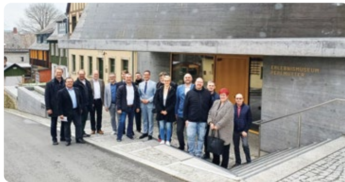
Společná fotografie účastníků setkání před adorfským muzeem