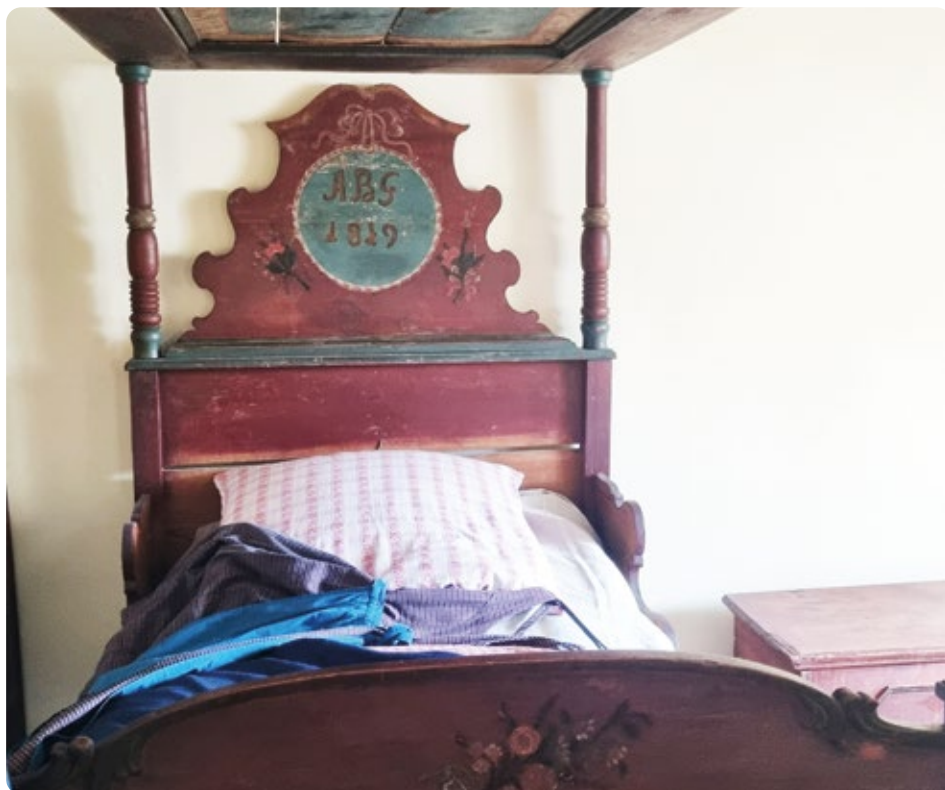
Postel. Ašský lidový nábytek (Heimatstube Rehau)

Mladý muž, který se dvořil dívce, se zeptal jejího otce, zda je žádoucí jako